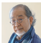
鎌田 實 医師・作家