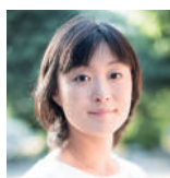
安田菜津紀 認定NPO法人 Dialogue for People フォトジャーナリスト