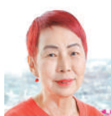
上野千鶴子 社会学者 東京大学名誉教授