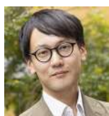
齋藤幸平 東京大学大学院 総合文化研究科 准教授