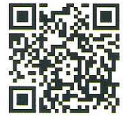
申込専用フォーム

パソコンの方は、 https://forms.gle/dXesqzgFyfxQ7PJdA （問合せ先のホームページにもリンクあり）