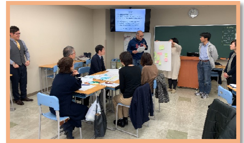
【グループワーク・発表】