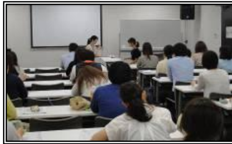
午前中の講義の様子